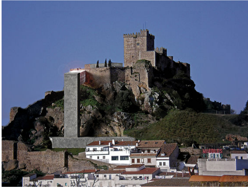
Alburquerque: fotomontaje realizado por la Plataforma en Defensa del Patrimonio.