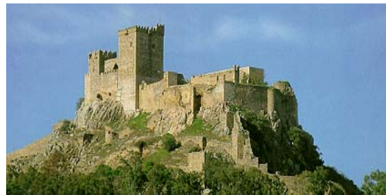
Alburquerque: castillo roquero medieval (s. XIII-XV)